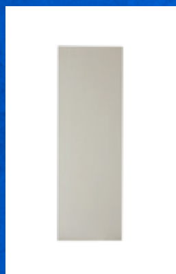
プラスチック製型枠