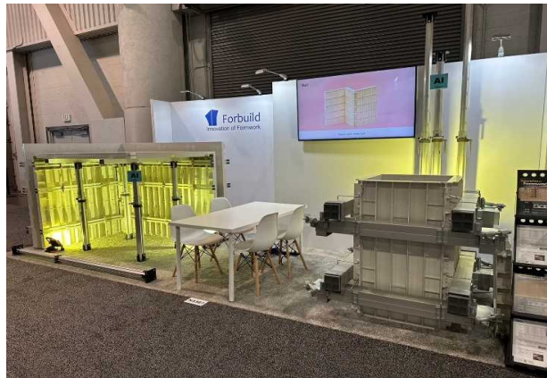
フォービルのブース